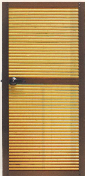
御簾垣扉 (専用柱2本、上胴縁付)