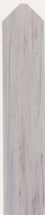
アンティークグレー