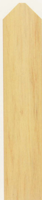
カントリーパイン