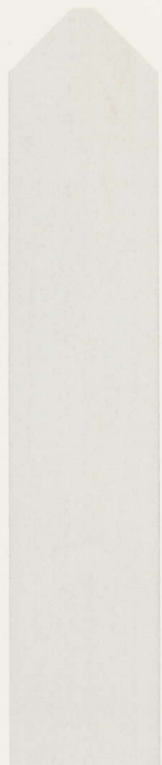
メープルホワイト